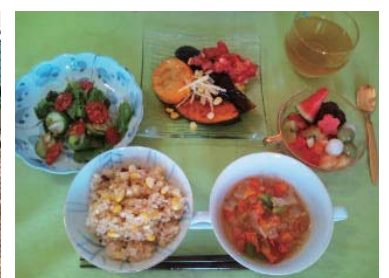
体が元気になる料理教室で作られた料理の一例